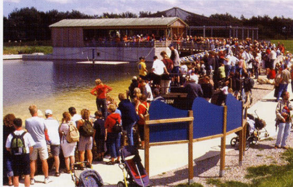
Die Seehundfütterung ist eine besondere Attraktion für die Besucher

Landschaftstypische Elemente der Westküste sind als Gestaltungsträger eingesetzt: Buschlandungen als Begrenzung des Besucherwegs, Muschelgrus als Wegebelag, der Sommerdeich als Abgrenzung zum übrigen Parkgelände.