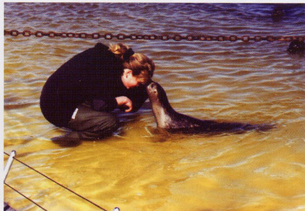
Eine vertrauensvolle Beziehung ist Voraussetzung für jegliches Training

wird dieses Training weiter aufgebaut, um den Tieren Beschäftigung und Bewegungsanreiz zu bieten und um den Besuchern bei der Fütterung die Fähigkeiten der Seehunde vorzuführen, aber auch um den veterinärmedizinischen Vorgaben des Landes Schleswig-Holstein zu entsprechen.