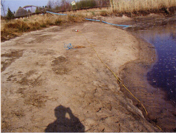
Im Zuge der Teichabsenkung war deutlich zu erkennen, dass keine Schlammschicht mehr besteht

Die Frage: wie kann ein Gewässer mit dieser Problematik saniert werden, ohne die Tiere zu schädigen, zu stören und auch zugleich wirtschaftlich vertretbar sein?