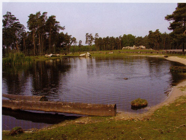
Blick auf die Seehundanlage

Der Gemeine Seehund ( Phoca vitulina ) hat unter natürlichen Lebensbedingungen in vielen Teilen seines Verbreitungsgebietes oft Kontakt mit Süßwasser, sei es an untermeerischen Süßwasserquellen, die er zum trinken aufsucht, oder im Bereiche von Flussmündungen z. B. an den Küsten Schottlands und Norwegens. Er wird regelmäßig auch viele Kilometer flussaufwärts beobachtet. Dort nutzt er seichte Uferbereiche als Ruheplätze ebenso gern wie die Sandbänke im Wattenmeer. Dort wo er ruht, sind seine Nahrungsgründe nicht weit und es besteht kein Zweifel daran, dass er eine Forelle ebenso wenig verschmählt wie einen Flusskrebis.