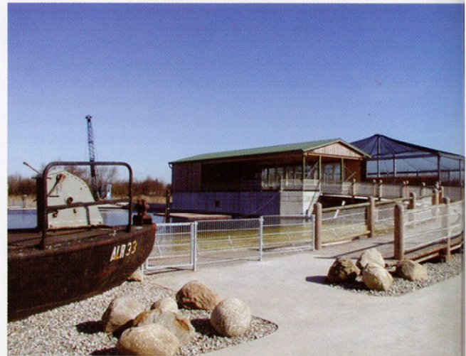
Das Robbarium ist in einem hafennähnlichen Ambiente gestaltet Wir haben uns entschieden, eine Anlage in hafennähnlichem Ambiente mit nachfolgenden Gestaltungsmerkmalen zu bauen:

das Spannungsfeld zwischen Natur- und Kulturraum auf. Gleichzeitig will es nicht nur optimale Haltungsbedingungen und eine abwechslungsreiche Umgebung für Seehunde und Basstölpel bieten, sondern stellt auch für Besucher eine besondere Attraktion dar.