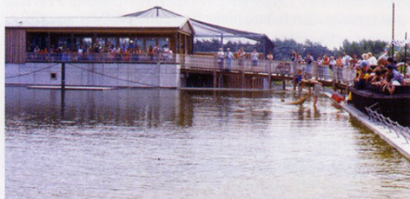
Das große Seehundbecken, im Hintergrund die Seevogelvoliere

Gebaut wurde die Robbenanlage endlich im Jahr 2002.