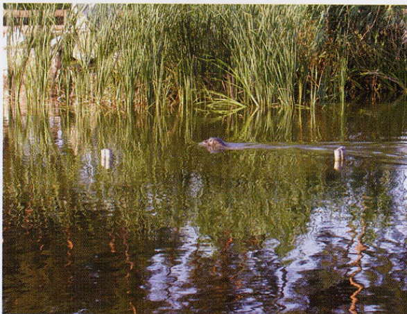
Der Seehund fühlt sich sichtlich wohl im sauberen Teichwasser

Das Wasser roch stark grasartig - der Schlamm jauchig. In diesem stehenden Gewässer lagerte sich Faulschlamm ab, der Wasserassel und Egel beheimatet. Die gleichzeitig explosionsartige Entwicklung der Wasserlinse (flächendeckend), veranlasste mit, dass eine sofortige Gewässeruntersuchung eingeleitet wurde, mit dem Ergebnis der Einstufung Güteklasse III = Belastung: stark verschmutzt. Die weiteren Untersuchungen ergaben, dass zu bestimmten Jahreszeiten über das Grundwasser, sowie über die Nachbargewässer, zusätzlich ein Nährstoffeintrag stattfindet. (Eintrag vermutlich aus landwirtschaftlichen Flächen sowie aus Aller u. Meiß.)