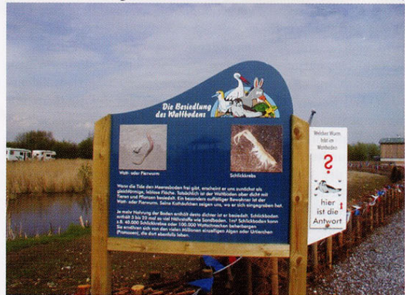
Infotafel mit interaktiven Element

Das Robbarium und speziell die Seehundfütterungen entwickelten sich schnell zu einem Publikumsmagneten. Technische Einrichtungen wie Headset und Lautsprecher, die zur Besucherinformation bei den Fütterungen eingesetzt werden, haben die Tiere nicht verunsichert. Die Möglichkeit, nach der Fütterung gezielt Fragen zu stellen, nehmen Besucher gerne in Anspruch. Zwischen den Fütterungen wird das Robbarium mit sanfter Entspannungsmusik beschallt. Dies trägt nicht nur zum Wohlbefinden der Besucher,