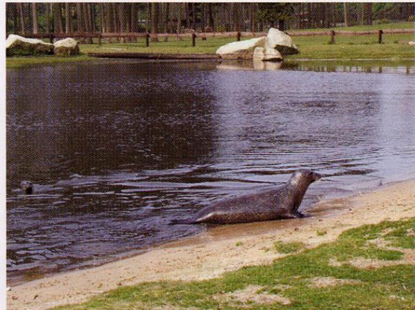
Seltener Anblick aber durchaus möglich, Seehunde am „Strand“ eines Teiches

Es erfolgte eine Umsiedlung von drei Individuen aus dem Erlebnispark in den Tierparkbereich. Auch dieses Gewässer wird durch Umfeldeintrag – Streichelwiese für landwirtschaftliche Nutztiere stark belastet und muss in der Selbstreinigung mit dem Plocher System unterstützt werden. Diese Anlage wird auch noch seitens der Wasserhaltung optimiert.